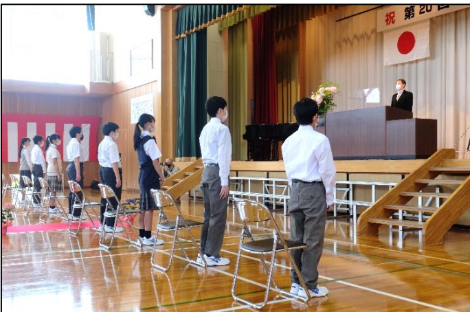
▲ 入学式 呼名に答える新入生

6月2日(火)、第20回となる本校の入学式を行いました。保護者の皆様、在校生代表、教職員が参列する中、新入生8名が元気に呼名に答えた後、校長先生からは「こんな時だからこそ、必要なのは温かさと思いやり、そして適応力です。」