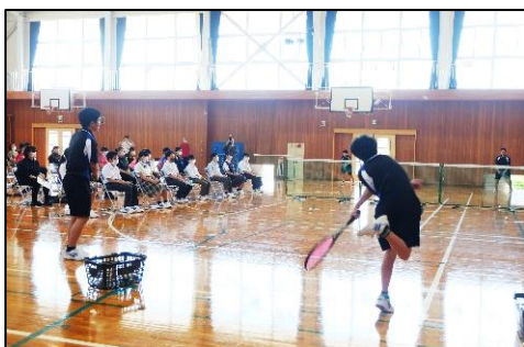
◀ 「新入生を迎える会」での部活動紹介

新入生を迎え入れ、3年生は最上級生、2年生は中堅学年という新たな立場で諸活動に取り組んでいます。それぞれの役割にふさわしい成長と活躍を期待したいと思います。